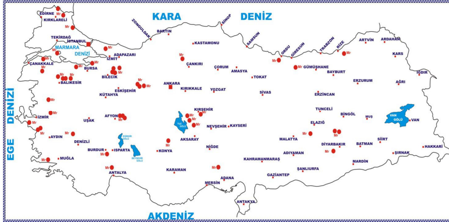
Şekil 1: Türkiye'nin Önemli Mermer Yatakları Haritası (TÜMMER, 2006b)

Aşağıdaki Şekil 1'de de görüldüğü gibi, Marmara ve Ege Bölgeleri başta olmak üzere, Trakya'dan Doğu Anadolu'ya kadar hemen tüm coğrafi bölgelerde, kaliteli ve ekonomik değeri yüksek nitelikte mermer rezervlerine rastlanmaktadır. Son yıllarda ülkemizde üretilen mermer renk ve türlerinde de artışlar meydana gelmiş ve daha önce birkaç bölgemizle sınırlı olan mermer ocak işletmeciliği Türkiye'nin birçok yöresine yayılmıştır. Yeni açılan mermer ocaklarının Batı Anadolu'da yer alan büyük sayıda olanları antik ocakların kapatılmasıyla ve işletilmesiyle faaliyete geçirilmiştir. Bu ocaklardan bir bölümü ekonomik yönden değerli hale girmiş, diğer yandan, birçok ocak ise belirli bir yatırımın ardından ekonomik olmamaları veya üretilen taşın kalitesinin uygun olmaması yönünden terk edilmiştir. Aynı dönem içerisinde Doğu ve Güneydoğu Anadolu Bölgelerinde yeni birçok mermer ocağı ilk kez bulunmuş ve faaliyete geçmiştir (Erdoğan ve Yavuz, 2002: 54; 2003).